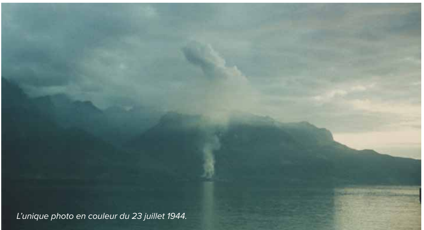
L'unique photo en couleur du 23 juillet 1944.

Le salut de la population gingolaise française vient de la bravoure et de l'amitié de nos amis suisses, qui contre les ordres de Berne, ouvrent la frontière et accueillent les réfugiés.