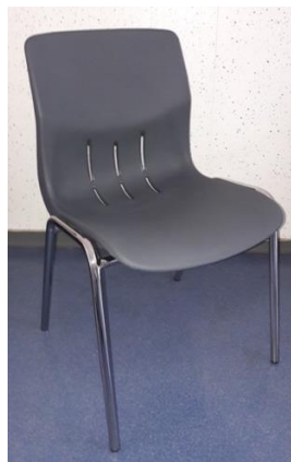
Chaises gris foncé, piètement noir EHL : 150x