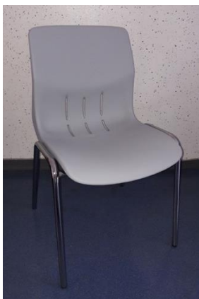
Chaises gris clair, piètement noir EHL : 150x