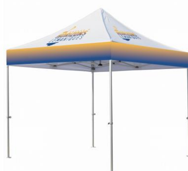
Chapiteau pliant 3x3m EHL : 1x