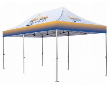
Chapiteau pliant 6x3m EHL : 1x