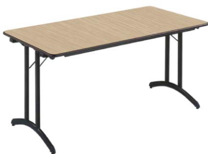
Table imitation chêne clair (160x80 cm) EHL : 50x